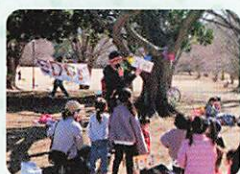
和光市チーム SDGs 「わこサス」

プレーパークを始める具体的な方法について(スーツケース型の遊び場キット「あそむーぶ1号(屋内用)」と「あそむーぶ2号(屋外用)」を使った遊び場づくりについても紹介)