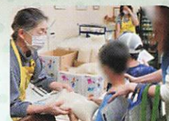
埼玉フード パントリー ネットワーク

子ども食堂を開催したいと考えている方へ、立ち上げから運営に至るまで、そのノウハウを実績豊富な運営者がアドバイスいたします。各地にいるエリアリーダーがどこへも伺います。