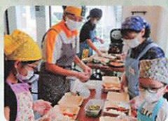
埼玉県 子ども食堂 ネットワーク

開催場所に悩んでいる子供の居場所運営団体へ、県内に所有する結婚式場や葬祭場などを、会場として提供します。