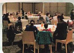
アルファクラブ 武蔵野 株式会社

子供の居場所活動に取り組む団体と、これから活動を始めたいと考えている方、またその活動を支援したいと考えている方々が、Zoomのブレイクアウトルームを使って実際に交流する場です。出展者から、日頃の活動の紹介とともに提供する支援・求める支援を呼びかけ、参加者の皆様と意見交換をし、最終的には出展者と参加者がマッチングすることが目的です。入退出自由です！ぜひご参加ください！