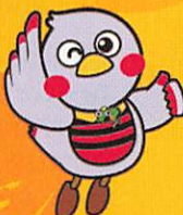
埼玉県マスコット 「さいたまっち」