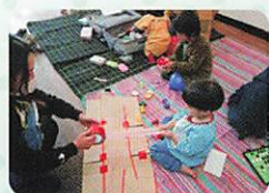
埼玉冒険 遊び場づくり 連絡協議会

最近になってネットワークに加盟する団体の数も急速に増え、食材のマッチングや輸送、保管場所の確保などが課題となっています。については、保管場所の提供や輸送の支援に御協力いただける方、また活動に協賛いただける企業様を募集します。